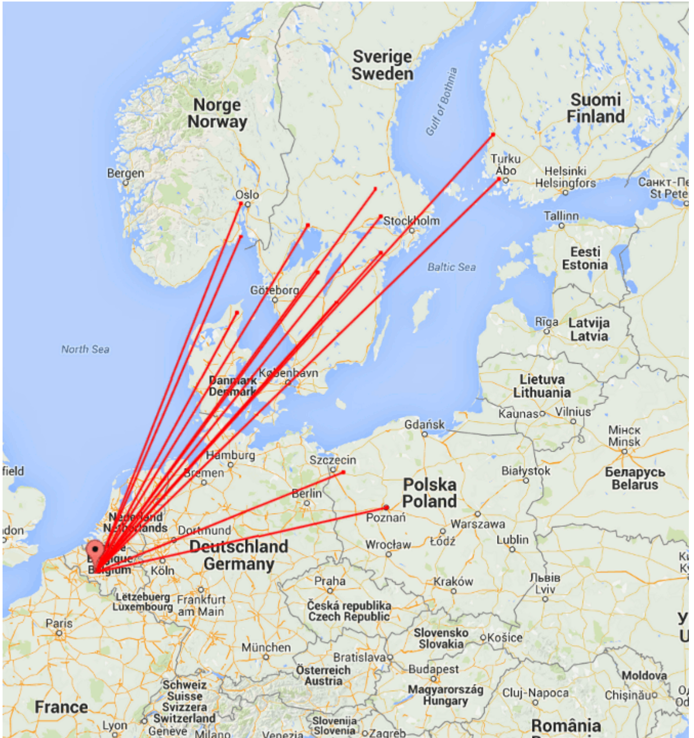
ODX OH1XT en KP01UK @ 1622 km